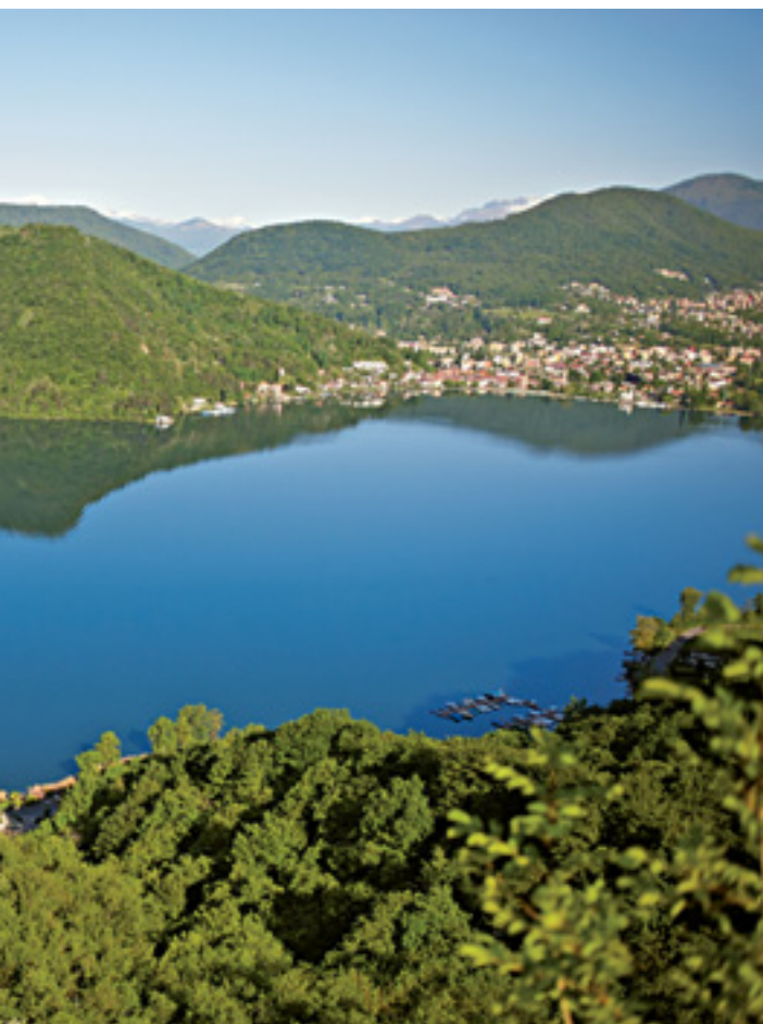
Blick vom »Sasso delle parole«, Agra.