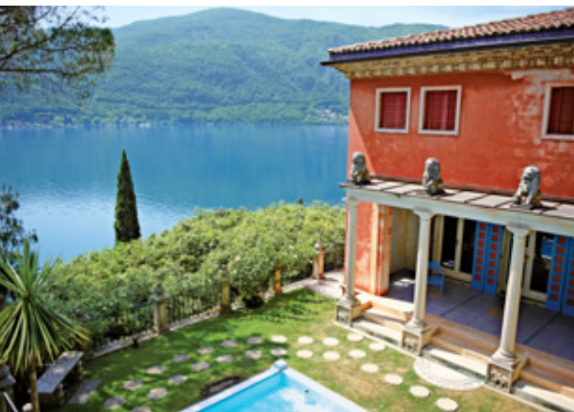
Parco Scherrer, Morcote