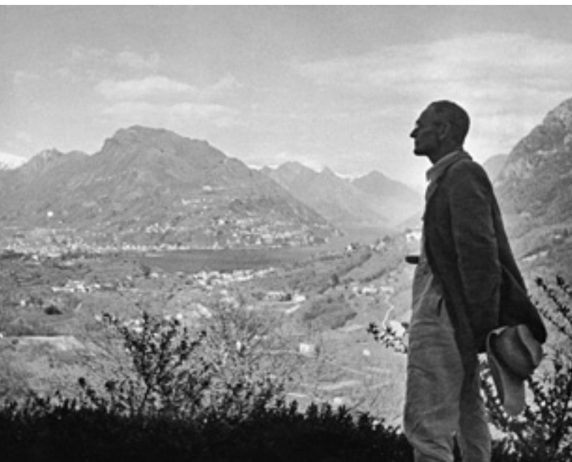
Hermann Hesse in Montagnola, 1937.