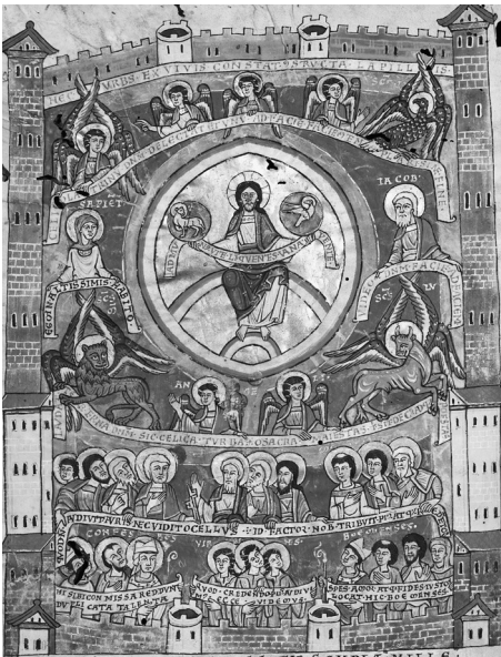
Böhmische Buchmalerei aus dem 12. Jh.: Das «Himmliche Jerusalem» galt besonders im Mittelalter als «Zentrum der Welt».

Die zentrale Bedeutung Jerusalems rührt nicht von ihrer physischen Beschaffenheit her, sondern von ihren metaphysischen Attributen. So konzentriert sich der Konflikt auf den Moriahberg, der seit Menschengedenken als heilig gilt. Lange bevor Salomon den ersten jüdischen Tempel über dem Felsen auf dem