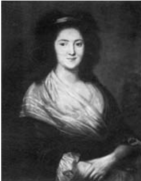
Henriette Herz. Gemälde von Anton Graff, 1792

Schönheit nicht unterschlägt, spielt das »reichste dunkle Haar« insofern eine besondere Rolle, als es, zu ihrer Betrübnis, bei jüdischen Ehefrauen durch einen Kopfputz so verdeckt werden mußte, daß nichts davon mehr zu sehen war. Diesen Zwang der Orthodoxie zu mißachten, indem sie ihr volles Haar in der Öffentlichkeit zeigte, war