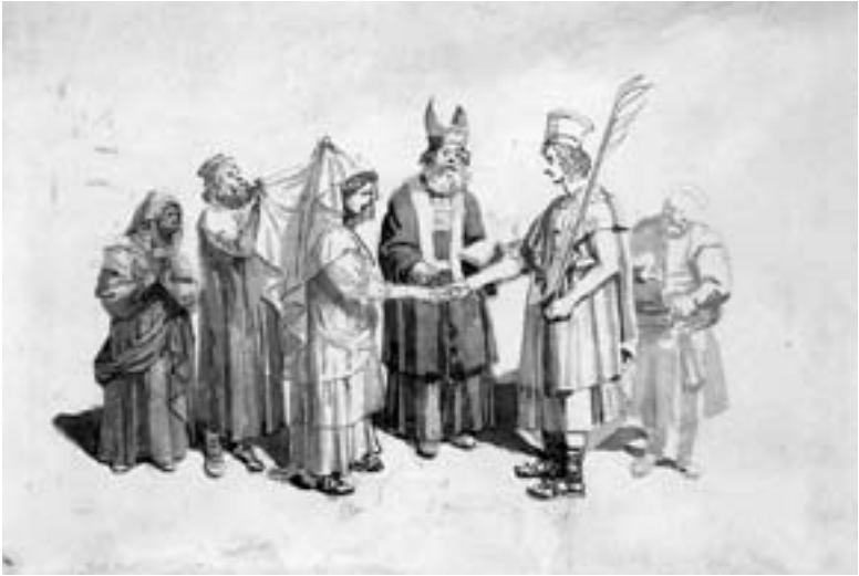
Jüdische Vermählungsszene. Federzeichnung von Johann Gottfried Schadow, um 1825

Tod ihres Mannes, so: »Meine Ehe darf ich ein glückliches Verhältnis nennen, wenn auch vielleicht nicht eigentlich eine glückliche Ehe. Die Ehe bildete für meinen Mann nicht den Mittelpunkt seines Seins. Und außerdem war die unsere nicht durch Kinder gesegnet. Wäre mir dies Glück vergönnt gewesen, ich weiß, ich wäre eine gute Mutter geworden, wie ich eine gute Gattin war. Denn das Zeugnis darf ich mir geben: Mein Mann wurde durch mich so glücklich, als er es überhaupt durch eine Frau werden konnte.« Von ihrem eigenen Glück aber sagt sie damit wenig. Vielleicht hat es darin bestanden, immer von vielen bedeutenden Männern umgeben gewesen und von manchen begehrt worden zu sein.