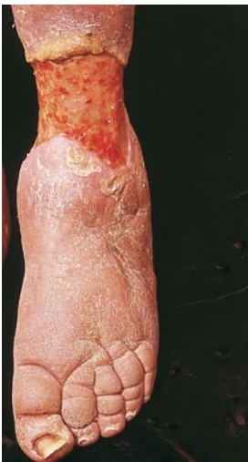
▣ Abb. 12.5. »Gamaschenulcus«. Beachte das Lymphödem distal des Ulkus (Schwellung bis zu den distalen Zehenphalangen – Stemmer-Zeichen!)