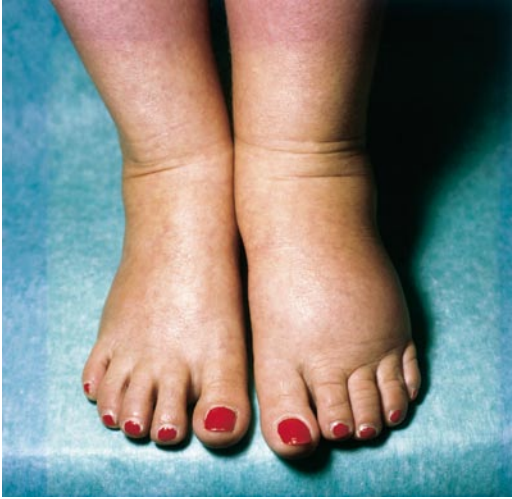
▣ Abb. 12.6. Lymphoedema praecox bei einem 17-jährigen, sonst gesunden Mädchen. Einseitige, schmerzlose Schwellung von Fußrücken und Zehen

ne Falten voneinander abgesetzt (Zehengrundgelenke!) die Zehen werden treffend als Quader-Zehen bezeichnet. Die Haut ist mit missfarbigen, stecknadelkopfgroßen, warzigen Papeln bestanden ( Papillomatosis lymphostatica – histologisch ektatische Lymphgefäße mit reaktiver Hyperkeratose). Bei weiterer Zunahme und Verhärtung kann das Spätstadium der Elephantiasis entstehen. Eine Störung des Lymphabstroms im Beckenbereich kann monströse Schwellungen im Genitalbereich bewirken (Penis, Skrotum).