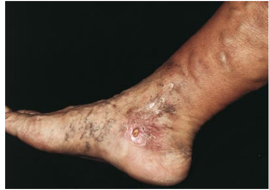
■ Abb. 12.3. Chronisch venöse Insuffizienz III° (CEAP C6). Varizen im V. saphena magna-Bereich, Ödem und Sklerose des Unterschenkels, Hyperpigmentierung (Hämosiderin), Ulcus cruris venosum und atrophe Narben im Malleolarbereich

Hautveränderungen am Unterschenkel (CEAP C4; ■ Abb. 12.3). Hämosiderin-Pigmentierung (C4a) ent-