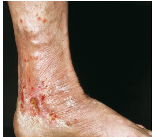
■ Abb. 12.4. Eczema cruris bei chronischer venöser Stauung. Beachte das retromalleoläre Ulcus cruris venosum und die zahlreichen (teils strichförmigen) Kratzeffekte