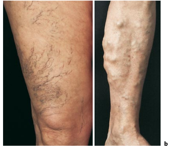
■ Abb. 12.2a,b. Varizen. a Besenreiservarizen. b Unkomplizierte Varizen vorwiegend im V. saphena magna-Bereich