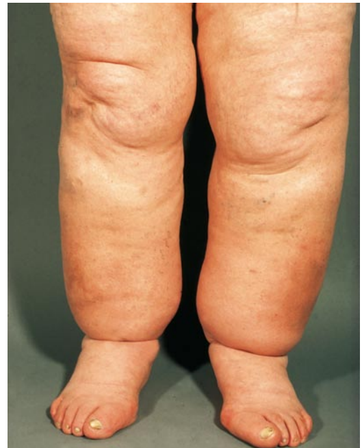
▣ Abb. 12.7. Lipödem bei einer 45-jährigen, sonst gesunden Frau. Beidseitige, symmetrische Schwellung der Beine unter Ausparung der Fußrücken (»Türkenbundhose«). Die Haut lässt sich am Fußrücken leicht abheben (Stemmer-Zeichen negativ)

Definition, Symptomatik. Eine anlagebedingte symmetrische Fettansammlung an den Beinen von Frauen mittleren Alters, die türkenbundhosenartig vom Be-