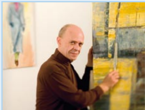
Beim Dreh für die DVD vom Buch

Wenn ich nicht an der Staffelei arbeite oder unterwegs bin, findet man mich in der Regel am Schreibtisch.