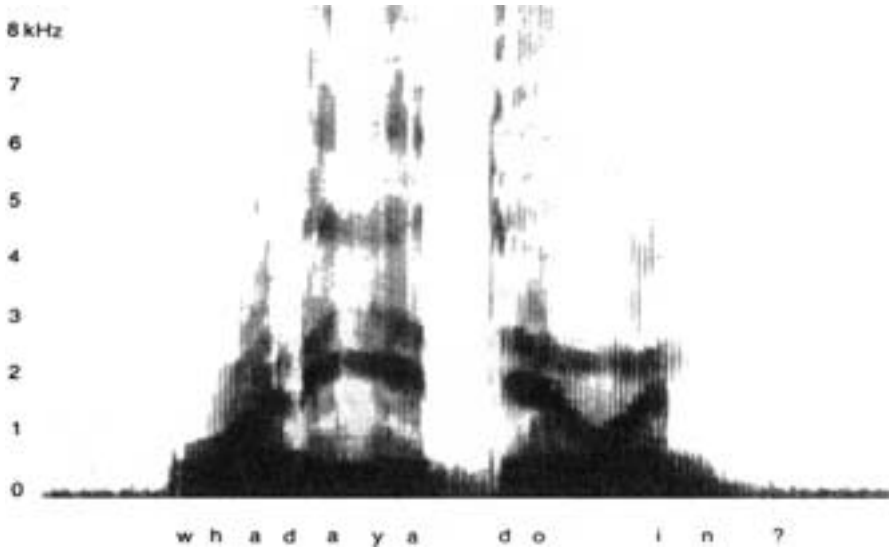
Abb. 1.2: In Alltagssprache gesprochener Satz (aus Goldstein, E. B. (1997). Sensation and Perception . Washington: Itps Thomson Learning)

frei sein können, wie „jung“, „Haus“ oder „Spiel“ oder gebunden wie „heit“, „keit“, „un“ oder „ver“. Wenn sie an ein freies Morphem geheftet werden, machen sie beispielsweise aus einem Verb ein Adjektiv (vergessen – vergesslich) und daraus ein Substantiv (vergesslich – Vergesslichkeit). Wie Morpheme in einer Sprache kombiniert werden dürfen, beschreibt die Morphologie . Morpheme können derivativ (Ableitungsmorpheme) sein, wenn sie die Wortklassen verändern (heiter – Heiter-keit), oder flexiv (Beugungsmorphem), wenn sie Wörter beugen (ich spring-e – du spring-st). Die Syntax beschreibt die Kombinationsregeln von Wörtern in einem Satz, durch die Sätze, die aus den gleichen Wörtern bestehen, unterschiedliche Bedeutungen erhalten können. Beispielsweise bedeutet „Hans liebt Grete“ tragischerweise nicht dasselbe wie „Grete liebt Hans“. Allerdings bedeutet „Grete wird von Hans geliebt“ dasselbe wie „Hans liebt Grete“, ein Ausdruck grammatischer Regeln, die angeben, wie Wörter und Morpheme in einer bestimmten Sprache kombiniert, organisiert und in eine Reihenfolge gebracht werden dürfen.