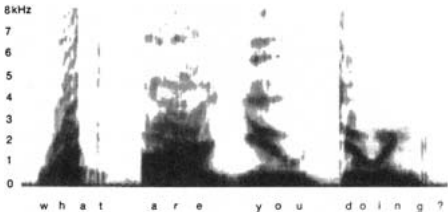
Abb. 1.1: Schallspektrum einzeln und deutlich gesprochener Wörter (aus Goldstein, E. B. (1997). Sensation and Perception . Washington: Itps Thomson Learning)

nen, wie beispielsweise Affrikative, bei denen ein eigentlicher Plosivlaut nicht vollständig aufgelöst wird, sondern in einen Reibelaut übergeht, wie bei /pf/. Unter der akustischen Perspektive werden die Merkmale der Schallsignale als Muster von Frequenzen und Intensitäten im zeitlichen Verlauf betrachtet. Sie lassen sich in einem Schallspektrum darstellen.