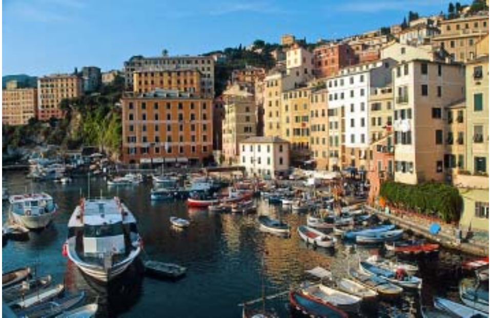
Farbenprächtig: das malerische Camogli