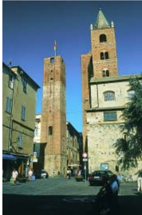
Ergeben eine markante Silhouette: die Geschlechtertürme von Albenga

Ab dem 5. Jh. entstand ein völlig neues Albenga , das nunmehr auch Bischofsitz war. Ende des 11. Jh. nahm die mittelalterliche Stadt mit einer eigenen Flotte am erfolgreichen ersten Kreuzzug ins Heilige Land teil, der dem Handel einen enormen Aufschwung und Albenga relative politische Unabhängigkeit bescherte. Die Seerepublik Genua musste diesen Aufschwung widerwillig dulden. Verschärft wurde die konfliktreiche Beziehung im 12. Jh. dadurch, dass sich Albenga auf die Seite Kaiser Friedrichs II. geschlagen hatte. Doch nach dessen Tod 1250 war die Stadt gezwungen, mit der großen Rivalin ein „Bündnis“ einzugehen. Zwar zeugen die rege Bautätigkeit und besonders die Entstehung der Geschlechtertürme im 13. Jh. vom Selbstbewusstsein der Bürgerschaft von Albenga, doch unter der Vorherrschaft Genuas, das die ligurische Provinz sträflich vernachlässigte und bewusst klein hielt, geriet auch das glanzvolle Albenga langsam in Vergessenheit. Hinzu kam höhere Gewalt: Der durch einen Kanalbau gestaute Centa -Fluss trat über die Ufer, überschwemmte das gesamte Stadtgebiet und zerstörte den Hafen. Spätestens seit dem 14. Jh. stand Albenga gänzlich unter dem Einfluss Genuas und war für Jahrhunderte von der mächtigen Nachbarin abhängig.