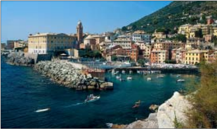
Der kleine Hafen von Nervi

• Essen & Trinken Ristorante Da Pino , alt-ingesessenes Fischrestaurant am Hafen, mit Pergola und viel Atmosphäre; zu den Meeresspezialitäten gibt es heimische Weine. Fischhauptgerichte um 12–19 €. Mittags