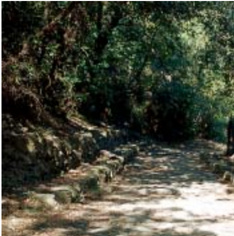
Steinalt: der Römerweg von Albenga nach Alassio

Nummehr auf der Höhe angelangt, wird der Weg zu einer ebenen Schotterpiste,