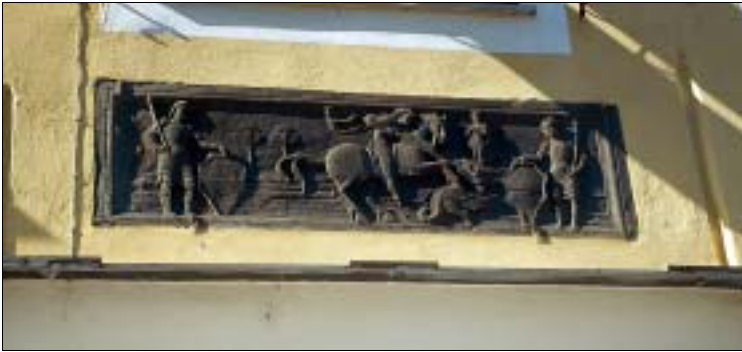
Fassadenschmuck: der Hl. Georg in Aktion

Baptisterium: Hinter der Kathedrale steht das älteste Sakralgebäude der Stadt und eines der bedeutendsten ganz Liguriens: die Taufkirche aus dem frühen 5. Jh. Das Fundament des gedrungenen Baukörpers liegt ein wenig unter dem Niveau der heutigen Straßenpflasterung. Eigenwillig ist der Grundriss: Während das Baptisterium außen unregelmäßig zehneckig ist, zeigt es sich im Innern achteckig. Die acht Marmorsäulen im Innenraum sind mit korinthischen Kapitellen verziert, in der Mitte platziert ist das ebenfalls oktagonale Taufbecken. Von großem kunstgeschichtlichem Wert sind die gut erhaltenen byzantinischen Mosaiken (spätes 5. Jh.) in der Altarnische des Baptisteriums.