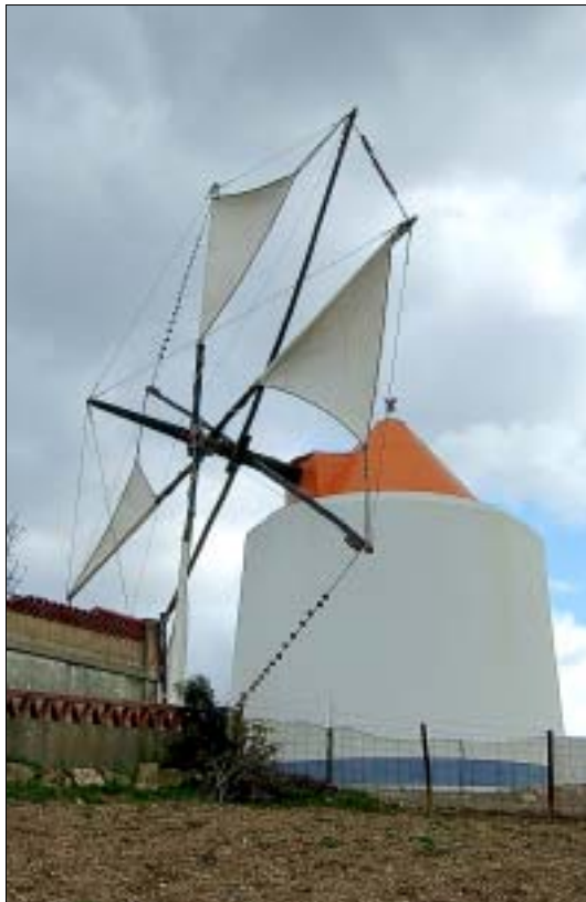
Eines der Wahrzeichen Odemiras

• Jugendherberge Weißer Kastenbau gleich am Dorfeingang rechts. Insgesamt 100 Betten, auch 10 DZ mit Bad (37 € in der Saison). Behindertengerecht, mit allem Komfort und gut besucht, da es weit und breit nichts Vergleichbares gibt. Reservierung (1,50 €) empfehlenswert. 15 % billiger mit Cartão Jovem. ☎ 283640000, § 283647035.