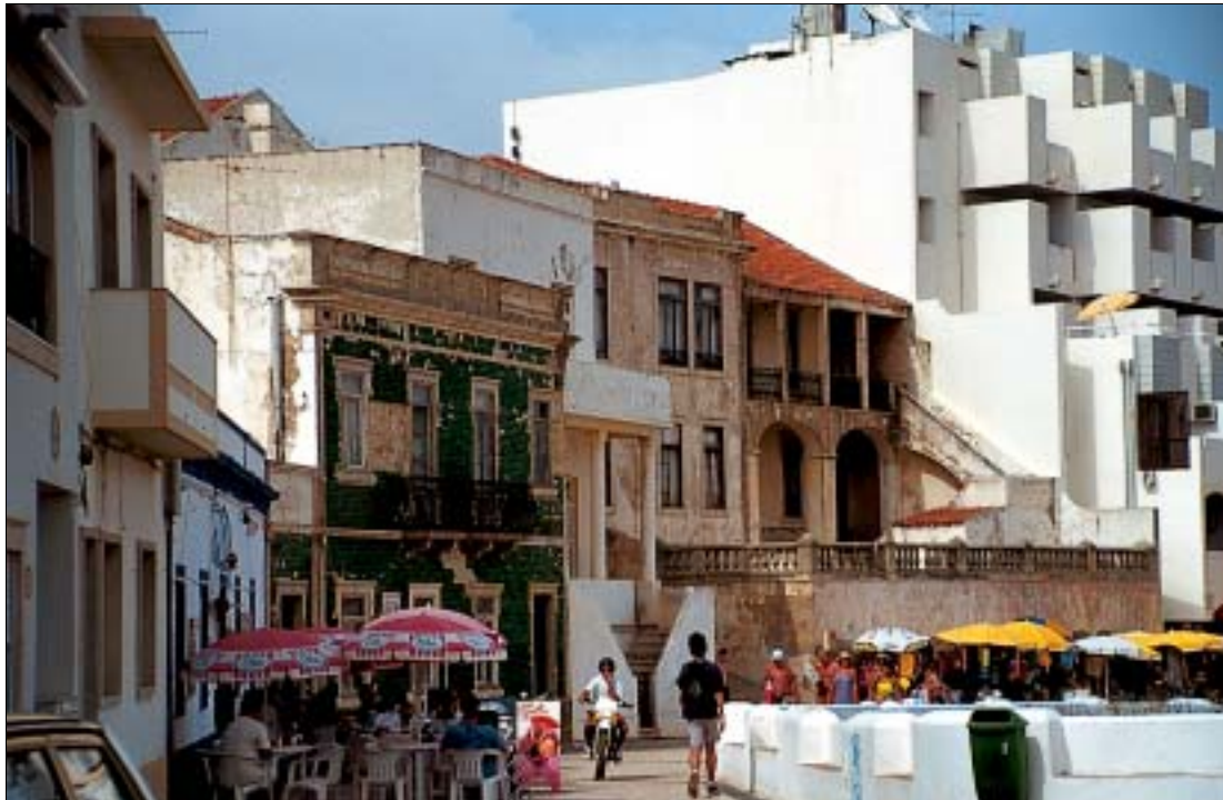
Auf die letzten „historischen“ Reste an der Promenade wartet die Spitzhacke

( Feijoada com Camarão ). Rua do MFA 97, ☎ 289587886. Di geschlossen.