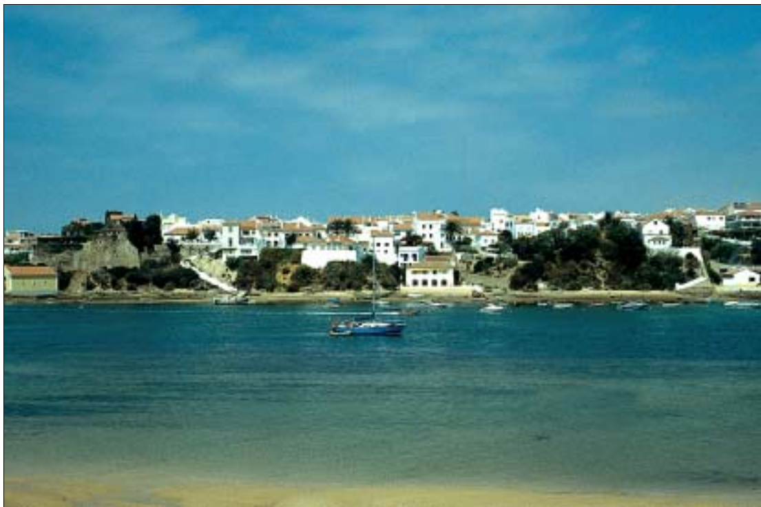
Blick vom Südufer des Rio Mira auf Vila Nova de Milfontes

Casa do Adro (12) , gemütliches, wenn auch etwas altbacken und kitschig eingerichtetes Stadthaus mit Frühstücksbalkon. 7 DZ zu 60–80 € inkl. Frühstück/Lunch je nach Saison. Am Kirchplatz in der Rua Diário de Notícias 10 A. ☎ 283997102. www.casadoadro.com, casadoadro@iol.pt