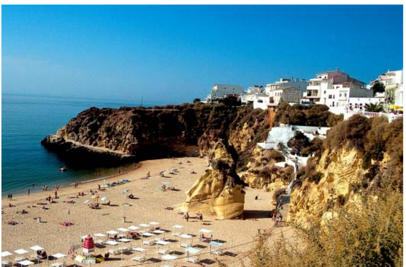
Der Hausstrand von Albufeira direkt unterhalb des alten Ortskerns