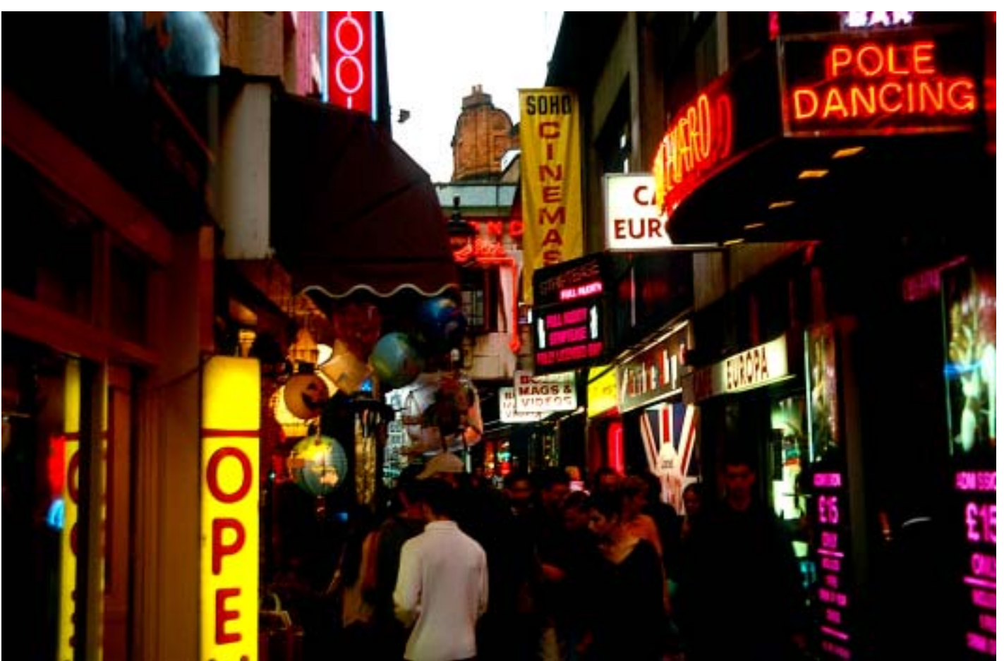
Soho – Zentrum des Londoner Nachtlebens