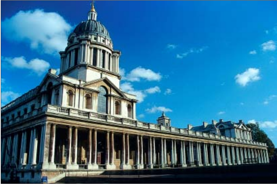
Vollendeter Klassizismus – Royal Naval College

spielsweise sehr anschaulich die großen Entdecker und ihre Expeditionen, allen voran James Cook (1728–1779), vorstellen; aber auch Fragen nach der Zukunft der Ozeane bleiben nicht ausgeklammert. Wer sich für Seeschlachten interessiert, kommt auch nicht zu kurz: Eine eigene Abteilung ist Lord Horatio Nelson (1758–1805), dem Helden von Trafalgar, gewidmet, eine andere den Kriegsschiffen des 17. und 18. Jahrhunderts. Kunstfreunde können in der Gemäldesammlung das Genre der Seeschlachtenmalerei studieren. (Nicht nur) für Kinder stehen zahlreiche interaktive Displays bereit, mit deren Hilfe man beispielsweise versuchen kann, ein Wikingerschiff oder ein Dampfboot auf dem richtigen Kurs zu halten.