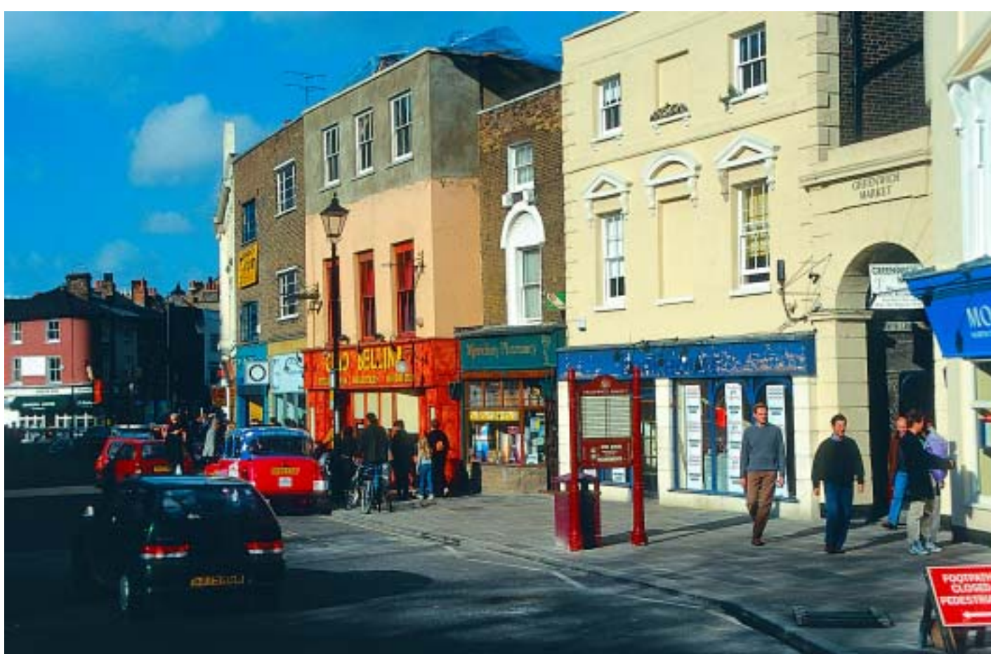
Greenwich – Vorort mit Flair