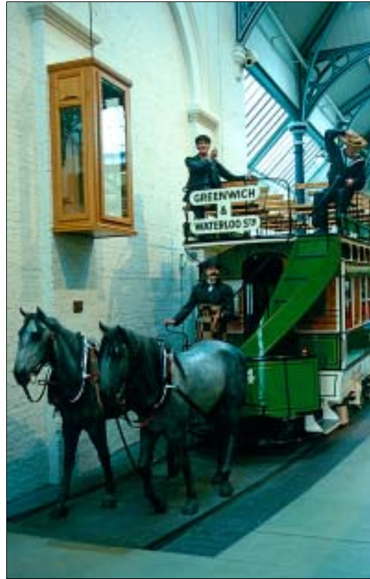
Der Vorgänger der Tube!

Photographer's Gallery: Die allererste Adresse in London für alle Freunde anspruchsvoller Fotokunst und sozialkritischer Photoreportagen. Auch wenn die Räumlichkeiten – in zwei benachbarten Häusern – von ihren Ausmaßen