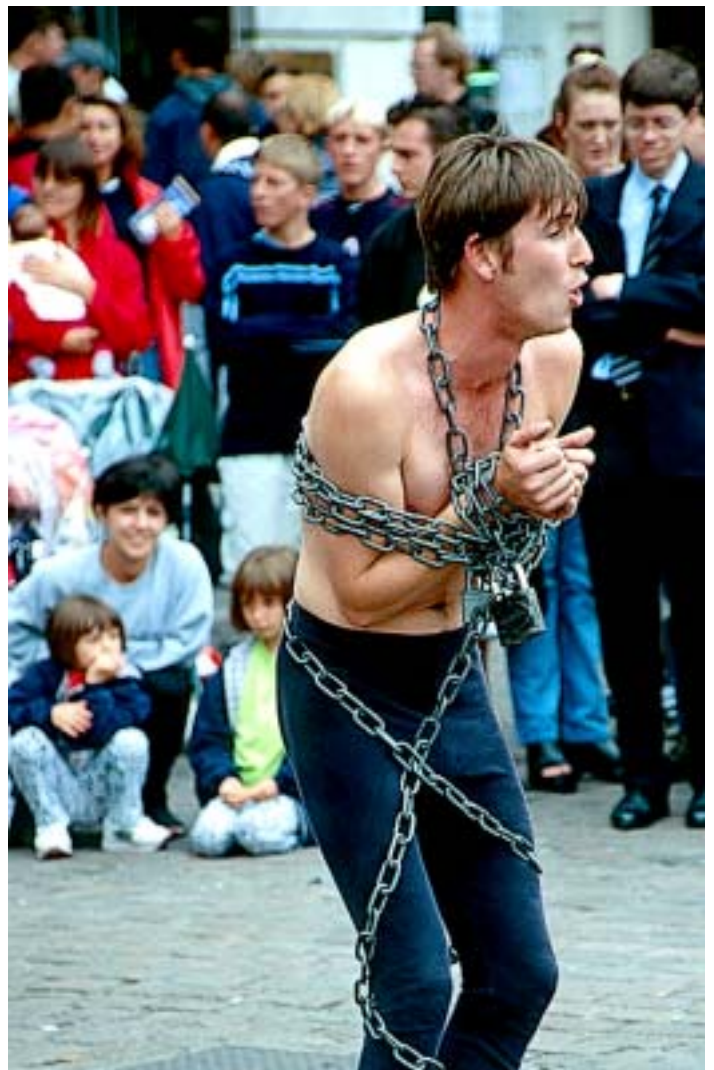
Kettensprenger in Soho

lionen Pfund renoviert und im Dezember 1999 mit Verdis „Falstaff“ wiedereröffnet wurde. Wer gerne einkaufen geht, findet in Long Acre und der Neal Street zahlreiche Boutiquen, rund um den Neal's Yard, einem kleinen Hinterhof, behaupten sich mehrere Ökoläden.