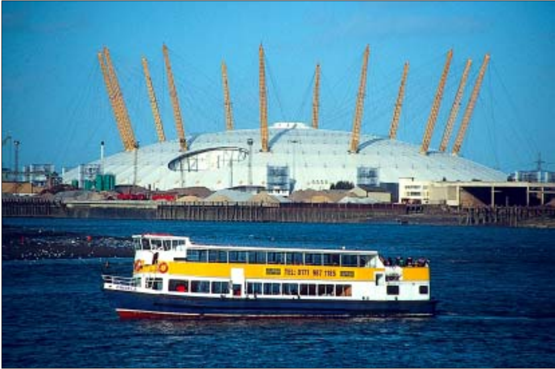
Millenium Dome – Flop des Jahrtausends?