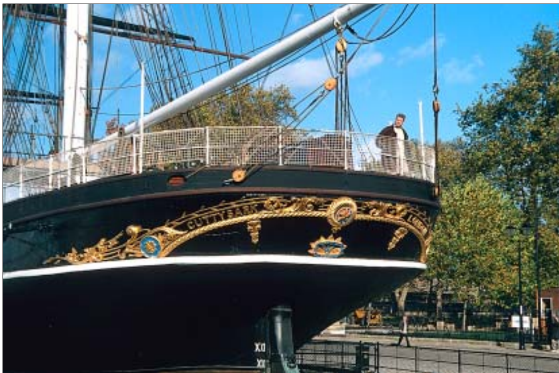
Zeuge von Englands großer Vergangenheit als Handelsmacht – Cutty Sark

Name des 1869 in Schottland vom Stapel gelaufenen Schiffes leitet sich vom kurzen Hemd ihrer Galionsfigur ab. Die Cutty Sark wurde von der East India