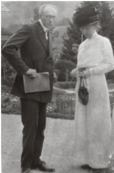
2. Annette Kolb und Franz Blei