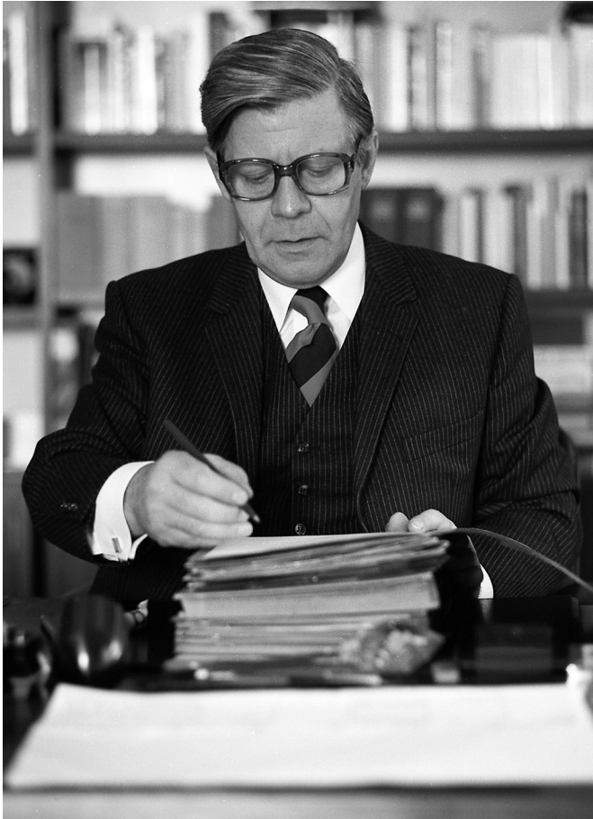
Helmut Schmidt 1969 – 1972 Verteidigungsminister 1972 Wirtschafts- und Finanzminister 1972 – 1974 Finanzminister 1974 – 1982 Bundeskanzler seit 1983 Herausgeber der »Zeit«