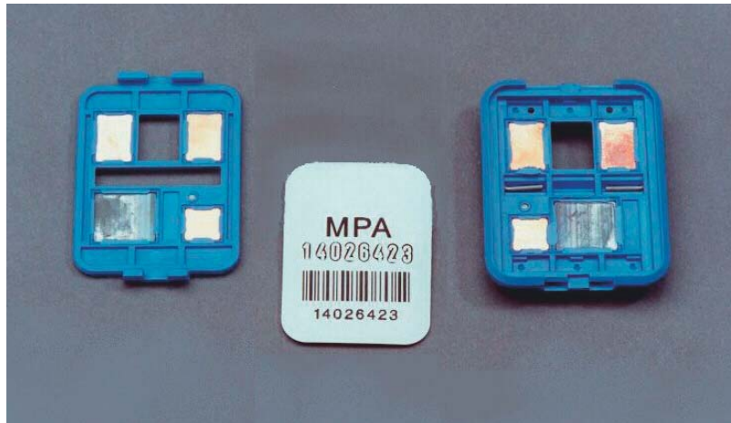
Abb. 4.1. Filmdosimeter, geöffnet

■ Häufigkeit der Messungen. Wie oft Kontaminationsmessungen durchzuführen sind, ist von der Art des Umgangs mit radioaktiven Stoffen abhängig. Mindestens einmal arbeitstäglich ist der Kontrollbereich auf Kontaminationen zu überprüfen. Aber auch während der Arbeit sollten Kontaminationsmessungen vorgenommen werden. Des Weiteren haben sich alle Personen beim Verlassen des Kontrollbereiches auf Kontaminationen, insbesondere der Hände und der Schuhe, zu prüfen.