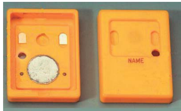
Abb. 4.2. Gleitschattendosimeter, geöffnet

Gleitschattendosimeter. Der Kassettenentyp der oben beschriebenen Filmdosimeter wird bald überholt sein, denn die Bauartzulassung für diese Kassetten ist abgelaufen. Ein neues Dosimeterkonzept, die