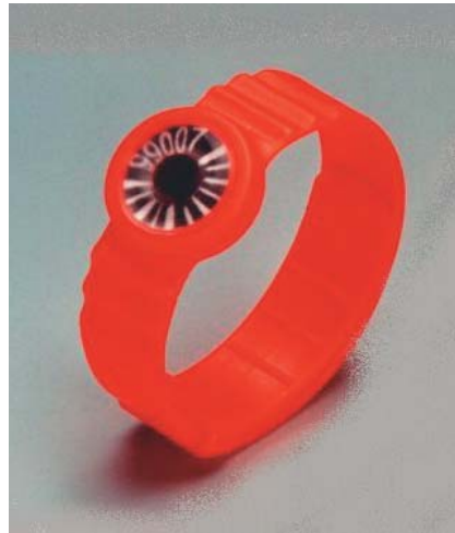
Abb. 4.4. Fingerring mit TL-Dosimeter

Stabdosimeter. Mit dem sog. Stabdosimeter kann die Personendosis jederzeit festgestellt werden. Es handelt sich hierbei um eine föllfederhalterähnliche Ionisationskammer mit einem Anzeigeinstrument. Stabdosimeter werden bei Tätigkeiten, bei denen Unfallgefahr (Möglichkeit der Überschreitung von