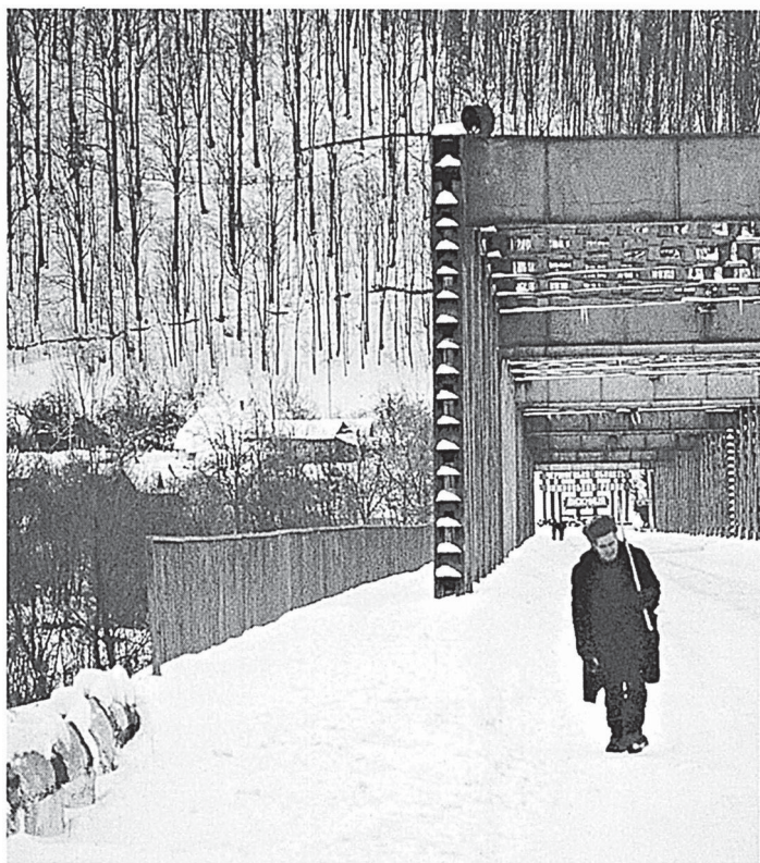
Tschornohora. Brücke über den Fluß Tscheremosch, 2003