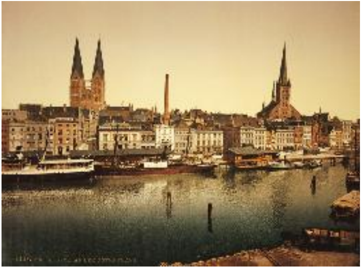
Lübeck, um 1900. Fotochrom

mag man Brandt nicht nennen. Etwas von einem typisch Norddeutschen hatte er gewiss mit seinem Hang zum Grübeln, zum In-sich-selbst-Verkriechen und zur Schwermut. Es sich leicht zu machen ist nicht die Art der Menschen dieser Landschaft; ihr Problem ist es, alles viel zu schwer zu nehmen. Gefühle werden nicht zu Markte getragen, sondern lieber tief verschlossen. Werden sie geäußert, sind sie manchmal mit Rührseligkeit versetzt. Wissen Sie, wie die meisten Menschen aus dem Norden bin ich im Grunde sentimental 18 , gesteht der Sechzigjährige der Journalistin, die seine Reserve und Verschlossenheit beklagt, und erzählt eine Anekdote, die es an der Ostsee in verschiedenen Variationen gibt: Die Geschichte von den beiden norwegischen Bauern, die jeder für sich auf einem Berghang leben und von Zeit zu Zeit einen miteinander heben. Ein Glas nach dem anderen. Erst als der Gast das letzte Glas geleert hat, sagte er «Skol». Der Gastgeber entgegnet wütend: «Du dumme Kerl, bist du gekommen, um zu trinken oder um zu schwatzen?» Das ist die andere Seite: Brandts Vorliebe für Witze, seine Freude an Ge-