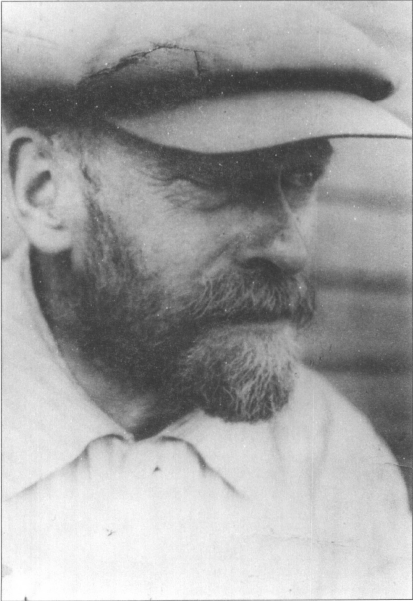
Korczak w Palestynie (1936)